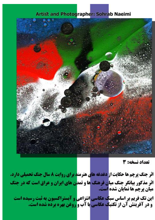
Artist and Photographer: Sohrab Naeimi